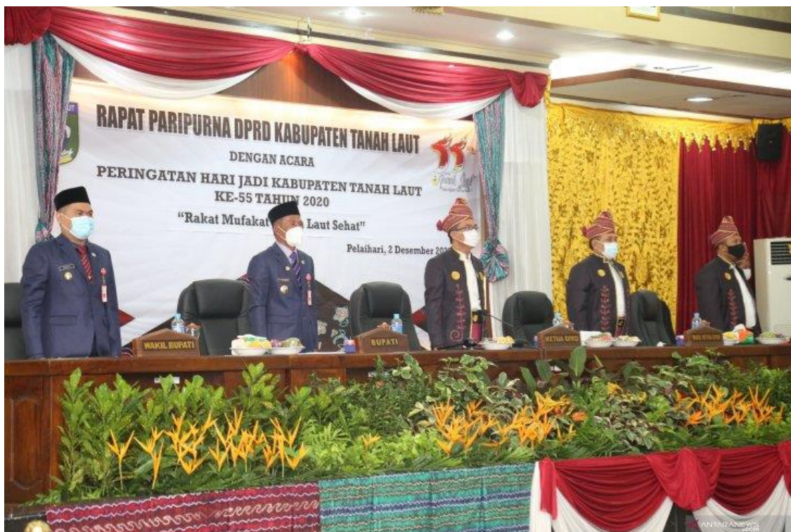
Pemkab Tanah Laut menggelar peringatan hari jadi ke-55 Kabupaten Tanah Laut