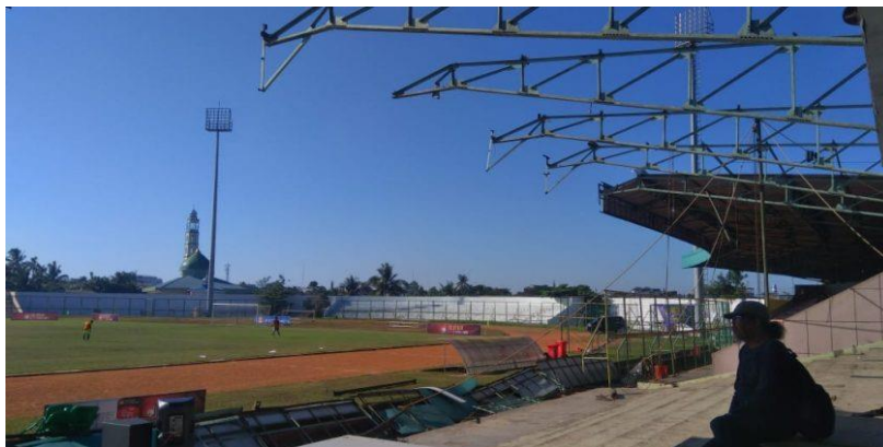
Rehab stadion 17 mei 2020 capai Rp40 miliar.

Memasuki tahap kedua pembangunan Stadion 17 Mei Banjarmasin, pemerintah Provinsi Kalimantan Selatan melalui Dinas Pemuda dan Olahraga kembali anggarkan biaya rehab stadion hingga mencapai Rp40 miliar untuk tahun 2020.